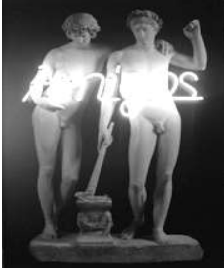
Resim 3: Michael Elmgreen & Ingar Dragset, Amigos, 2011