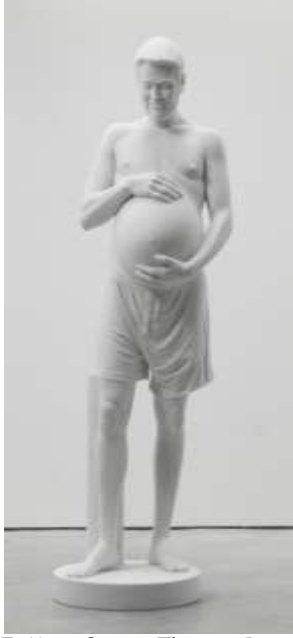
Resim 7: Marc Quinn, Thomas Beatie, 2009

Beden, üzerinde araştırma yapılabilecek bir alan olarak her zaman izlenmeye ve yeniden tasarlanmaya açık bir yapıdır. Sahip olduğumuz beden süreç içinde yeniden tanışabileceğimiz sürekli dönüşüm geçiren bir organizma olup, zihinsel ve ruhsal süreçlerle karmaşık biçimde birbirine bağlıdır. Bedende her zaman beklenmedik değişimlerle karşılaşmak mümkündür. Ya da insan bu değişimi kendisi gerçekleştirmek isteyebilir. Bu doğal değişimi ve farklılığı inanılmaz bulan ve dışlayan zihinleri tek yönlü bakış açısından kurtarmak zor bir mücadeledir. Bu mücadeleyi aradaki perdeleri kaldırarak gerçekleştirmek isteyen bir başka sanatçı JEB kısaltmasını kullanan Joan Elizabeth Biren'dir. Sanatçının: "Değiştirmek istediğimi imajlar aracılığıyla yapabilirim. Niyetim insanları birbirlerine görünür kılmak. Gizlendiğinizde politik bir değişim gerçekleştiremezsiniz. .. Bir kadın, bir lezbiyen ve bir feminist olarak, bu üç özelliğimi zihnimden atabilirim fakat varoluşumu asla." (Silberman, 2011:10-13) şeklinde ifade ettiği düşüncelerini fotoğraflarında da izlemek mümkündür. Sanatçı 2011 tarihli Jan ve Barbara'yı Lezbiyen Sağlık ve Danışmanlık Kolektifinde Bir Rahim Araştırması Yaparken isimli fotoğrafıyla (Resim 8), konuyu doğal bir sağlık araştırması sahnesi olarak görüntüler.