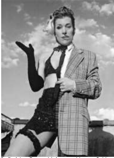
Resim 10: Del La Grace Volcano, Yarım & Yarım, 1998.

Volcano, kendi çalışmalarını üzerine yazdığı makalesinde: